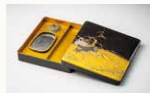
芦間鶴時絵硯箱 江戸時代 17世紀 泉湧寺蔵