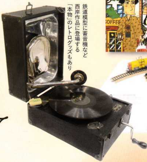
鉄道模型に音機など 西岸作品に登場する 「本物」のレトログッズもあり