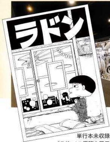
単行本未収録! 「ラドン」の原稿を展示。