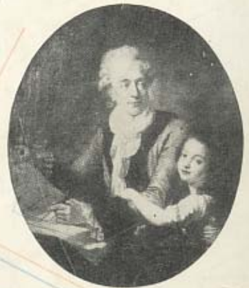
① — ルドウと彼の娘 C.-N. Ledoux and his daughter