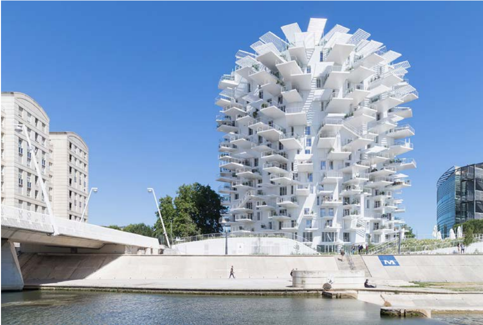
L'Arbre Blanc 多目的タワー「ラルブル・ブラン(白い木)」

京都美術工芸大学 東山キャンパス 〒605-0991 京都府京都市東山区川端通七条上ル TELL:075-525-1515 (代表) FAX:075-533-6033 (代表)