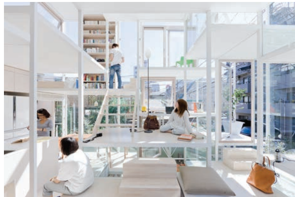
House NA