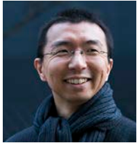
ふじもと・そうすけ

1971年北海道生まれ。東京大学工学部建築学科卒業後、2000年藤本壮介建築設計事務所を設立。2014年フランス・モンペリエ国際設計競技最優秀賞、2015年パリ・サクレ・エコール・ポリテクニック・ラーニングセンター国際設計競技最優秀につき、2016年Reinventer Paris国際設計競技ポルトマイヨ・パーシング地区最優秀賞を受賞。2017年ベルギー・ブリュッセル国際設計競技最優秀賞、フランス・ニース国際設計競技最優秀賞を受賞。2018年ザンクト・ガレン大学HSGラーニング・センター国際設計競技最優秀賞につき、フランス・ロニーヌー＝ボワ国際設計競技最優秀賞を受賞。主な作品に、ロンドンのサーペンタイン・ギャラリー・パビリオン2013(2013年)、House NA(2011年)、武蔵野美術大学美術館・図書館(2010年)、House N(2008年)等がある。